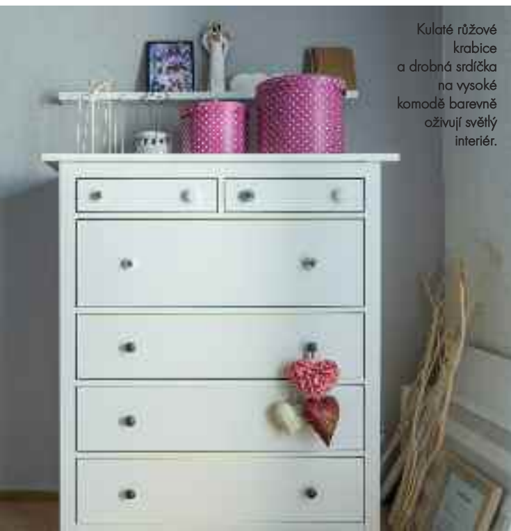
Kulaté růžové krabice a drobná srdíčka na vysoké komodě barevně oživují světlý interiér.