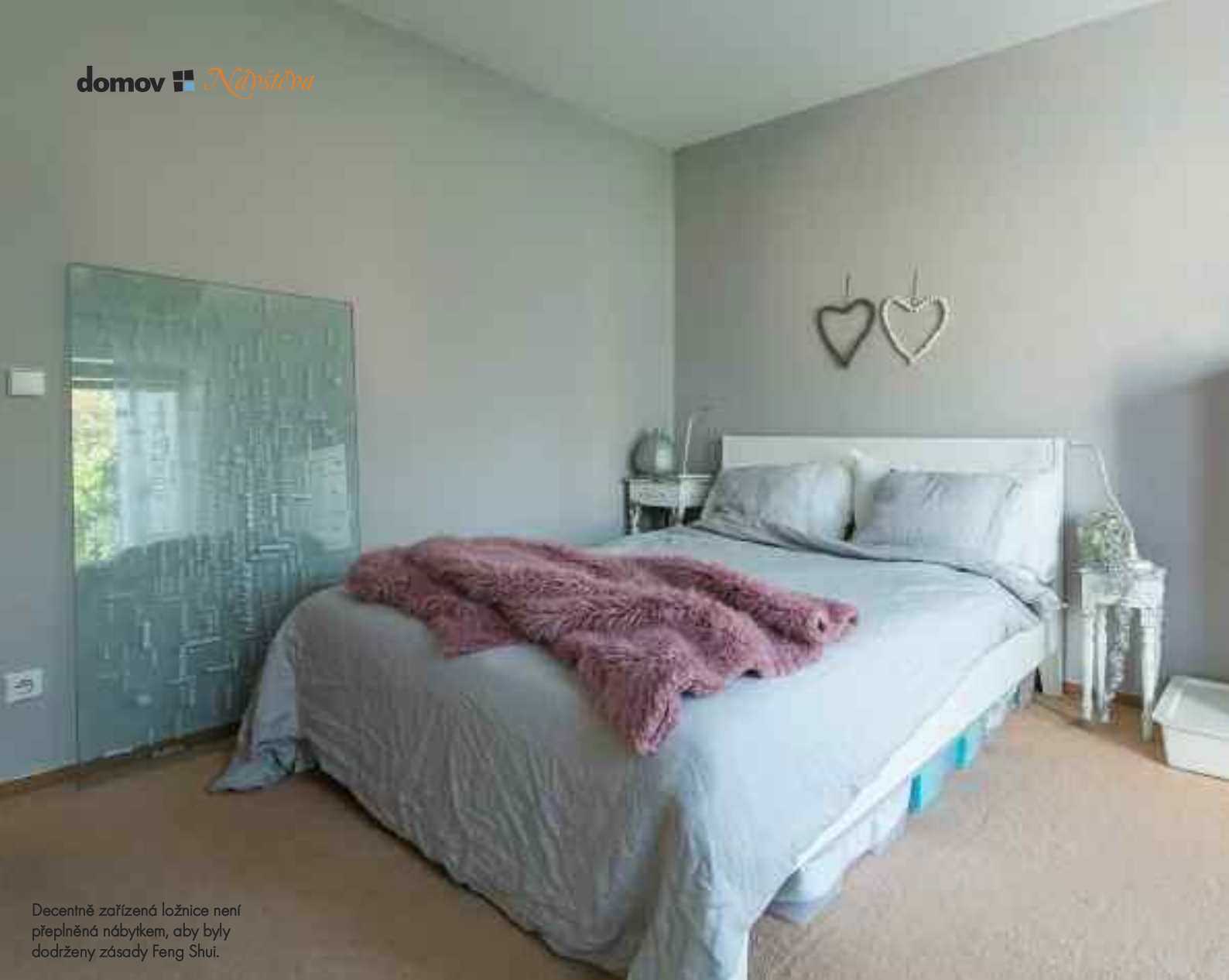
Decentně zařízená ložnice není přeplněná nábytkem, aby byly dodrženy zásady Feng Shui.